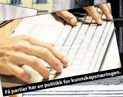
Få partier har en politikk for kunnskapsnæringer.