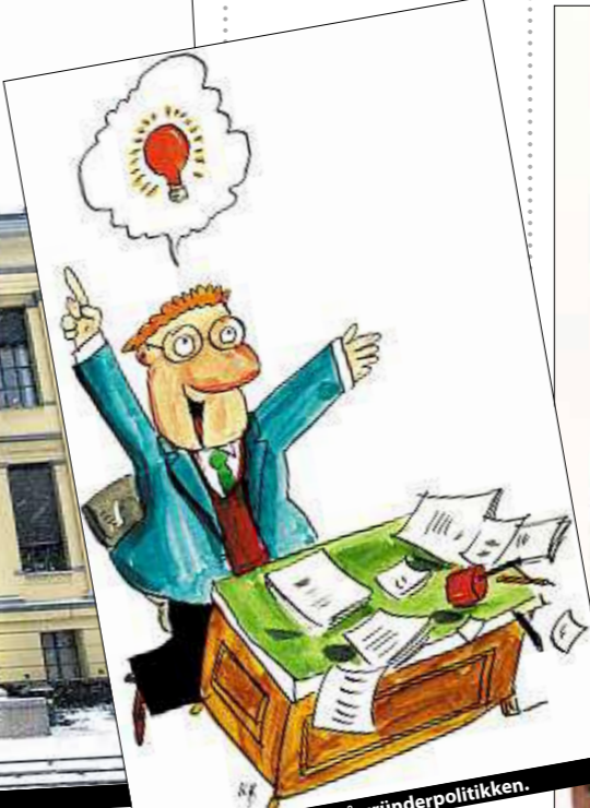
Venstre er klart best på gründerpolitikken.