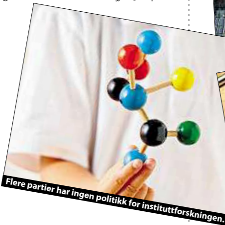
Flere partier har ingen politikk for institutforskningen.